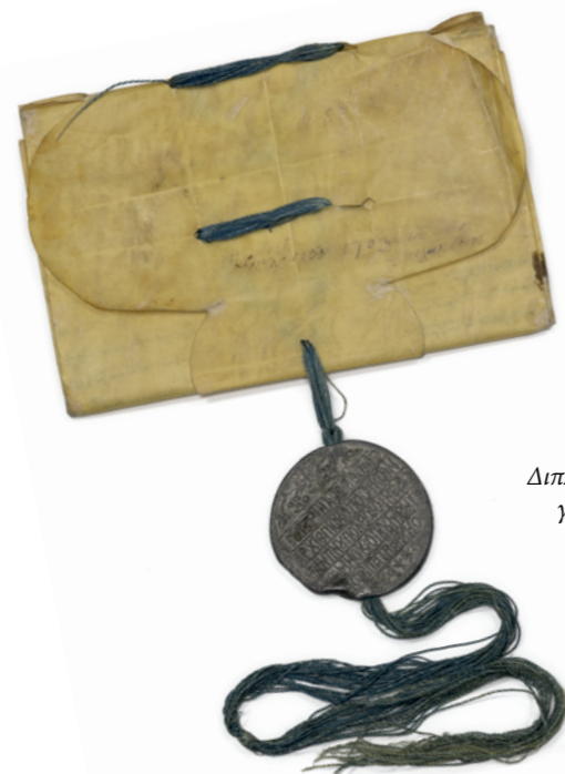
Διπλωμένο έγγραφο με μολυβδόβουλλο για την εξασφάλιση της γνησιότητάς του. Συλλογή Μονής Βλατάδων.

οι έκδικοι ή εκκλησέκτικοι ήταν συμβούλιο αξιωματούχων στον ναό της Αγίας Σοφίας. Επικεφαλής τους ήταν ο Πρωτέκδικος. Ο ρόλος τους ήταν δικαστικός. Προστάτευαν τους φτωχούς και ανυπεράσπιστους, βοηθούσαν στη διοίκηση και φρόντιζαν για την καλή λειτουργία του ναού.