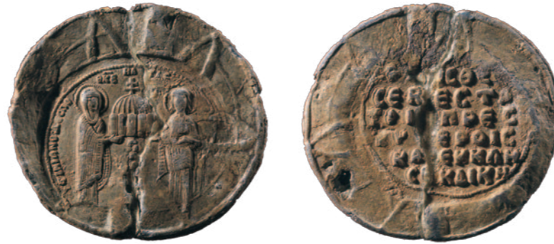
α' πλευρά (εμπροσθότυπος)