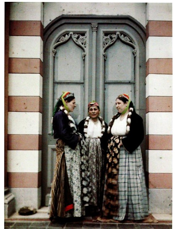
1913, Auguste Léon. Εβραίες της πόλης με τη χαρακτηριστική ενδυμασία, μπροστά στην έπαυλη Αλλατίνι*

Τα 2/3 του πληθυσμού κατοικούσαν εντός των τειχών -η προαστιοποίηση βρισκόταν ακόμη στα σπάργανα. Οι Μουσουλμάνοι κατοικούσαν κυρίως στην Πάνω Πόλη, οι Εβραίοι κυρίως στην κάτω πόλη κοντά στη θάλασσα ενώ οι Έλληνες σε γενικές γραμμές στις παραδοσιακές τους συνοικίες του ανατολικού και του δυτικού τομέα. Με βάση τα στοιχεία της απογραφής, ήταν πολύ λίγες οι γειτονιές που ανήκαν αποκλειστικά στη μια ή στην άλλη θρησκεία. Με άλλα λόγια, στη Θεσσαλονίκη δεν υπήρχαν γκέτο και οι θρησκευτικές κοινότητες της υστεροοθωμανικής πόλης ήταν εξαιρετικά αλληλένδετες .