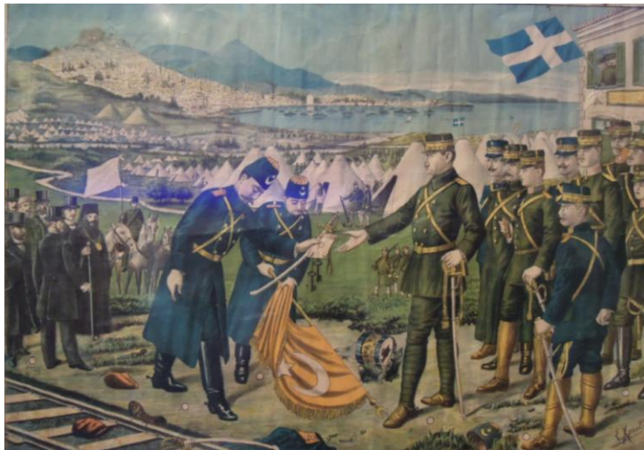
Η παράδοση της Θεσσαλονίκης στον διάδοχο Κωνσταντίνο στο Τόψιν (χρωμολιθογραφία)**

Το επόμενο πρωί απόσπασμα ευζώνων και τμήμα ιππικού μπήκε στην πόλη και κατέλαβε το Διοικητήριο. Λίγο αργότερα μπήκε στην πόλη ο αρχιστράτηγος διάδοχος Κωνσταντίνος με το επιτελείο του και την 1η μεραρχία και το μεσημέρι έγινε δοξολογία στο ναό του Αγίου Μηνά. Στις 29 Οκτωβρίου έφθασε στην πόλη και ο βασιλιάς Γεώργιος Α΄.