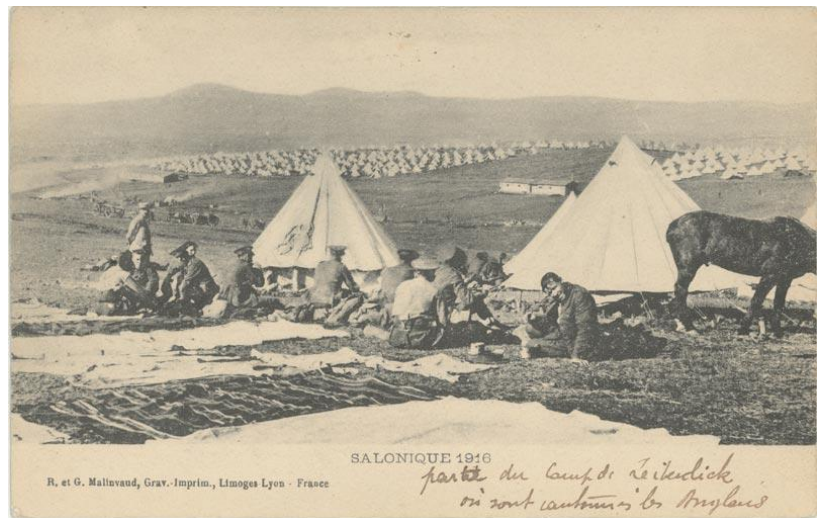
1916. Γαλλική καρτ-ποστάλ, όπου απεικονίζεται τμήμα του αγγλικού στρατοπέδου της Στρατιάς της Ανατολής στο Ζεϊτενλίκ**

Τον Οκτώβριο του 1915 η Στρατιά της Ανατολής αποτελούμενη από αγγλογαλλικά στρατεύματα αποβιβάστηκε στη Θεσσαλονίκη παραβιάζοντας την ουδετερότητα της Ελλάδας. Μέχρι τις αρχές του 1916 είχαν αποβιβαστεί 230.000 στρατιώτες. Βλέποντας τα οφέλη της Ελλάδας από τους βαλκανικούς πολέμους του 1912-13 να κινδυνεύουν, ομάδα φιλοβενιζελικών αξιωματικών στη Θεσσαλονίκη προχώρησε στο κίνημα της Εθνικής Άμυνας τον Αύγουστο του 1916, με στόχο να μπει η Ελλάδα στον πόλεμο στο πλευρό της Αντάντ. Τον Οκτώβριο του 1916 έφτασε στη Θεσσαλονίκη, για να αναλάβει την ηγεσία του κινήματος, ο Βενιζέλος και η προσωρινή κυβέρνηση που είχε σχηματίσει με το ναύαρχο Παύλο Κουντουριώτη και το στρατηγό Παναγιώτη Δαγκλή. Ο εθνικός διχασμός ήταν γεγονός.