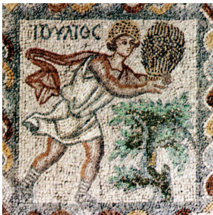
Τμήμα ψηφιδωτού δαπέδου από κτήριο στην οδό Πλουτάρχου 6, Θήβα, 6ος αι. μ.Χ.

▶ Παρατηρήστε την εικόνα στη διπλανή σελίδα που απεικονίζει τους μήνες Ιούλιο και Αύγουστο. Τι κρατάει ο μήνας Αύγουστος;