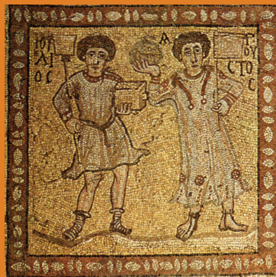
Τμήμα ψηφιδωτού δαπέδου από οικία δίπλα στο αρχαίο θέατρο, Άργος, 6ος αι. μ.Χ.