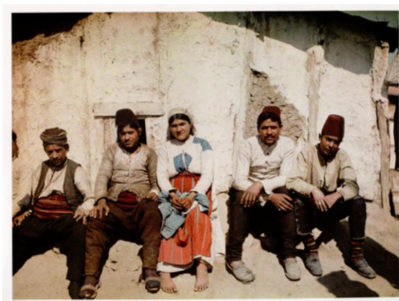
φωτ. α: Σκηνή από καταυλισμό Τσιγγάνων

1. Βρείτε στην έκθεση τα σχέδια που απεικονίζουν ανθρώπους της πόλης και εντοπίστε τα νούμερα 2, 4, 5 και 6. Δείτε και τις παρακάτω φωτογραφίες. α. Παρατηρήστε τα ρούχα των ανθρώπων. β. Γράψτε το θρήσκευμά τους ή την καταγωγή τους.