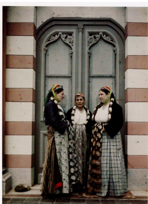
φωτ. β: Εβραίες της πόλης