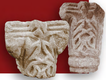
Fragments de petits chapiteaux, VI s.