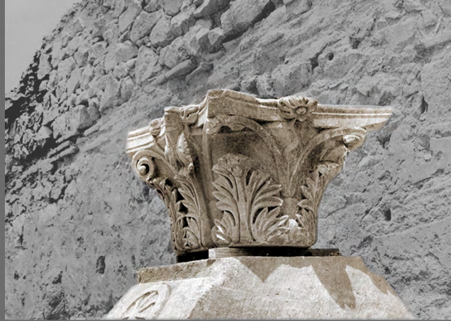
Chapiteau (VIe s. apr. J.C.)