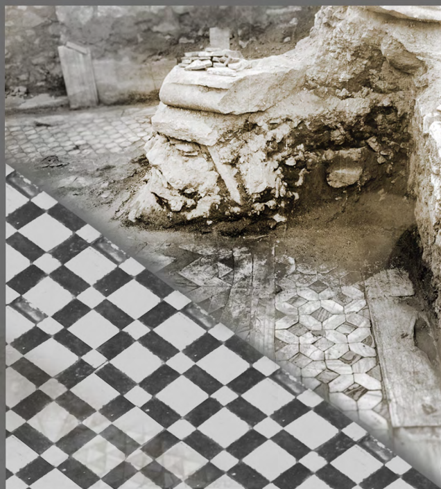
Pavement en opus sectile