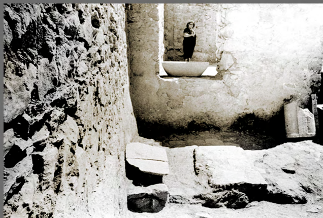
Eutychia dans l'une des annexes